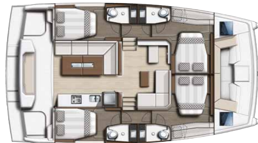
4 cabins family version / Version 4 cabines family