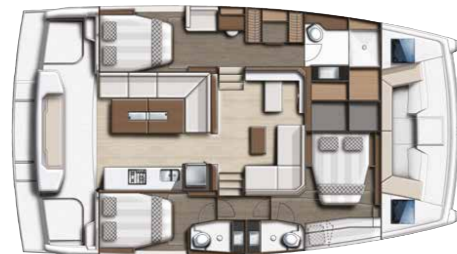
3 cabins Owner's version / Version 3 cabines propriétaire

Draft / Tirant d'eau Fresh water capacity / Eau douce Fuel capacity / Carburant Refrigerator + freezer / Réfrigérateur + congélateur Engines power / Motorisation CE CAT : 2'11" / 0.89 m up to / jusqu'à 700 L / 154 US Gal up to / jusqu'à 1400 L / 308 US Gal 272 L / 9.6 cu ft Yanmar 2 x150 up to 2 x 250 HP / CV Pending / En cours